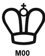
Kuva 2. Tarkastuslaitoksen sinetöintimerkki ja tarkastuslaitoksen tunnus.