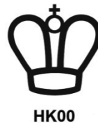
Kuva 3. Huoltoliikkeen sinetöintimerkki ja huoltoliikkeen tunnus. Huoltoliikkeen tunnus on HK ja kaksinumeroinen luku yhteen kirjoitettuna.