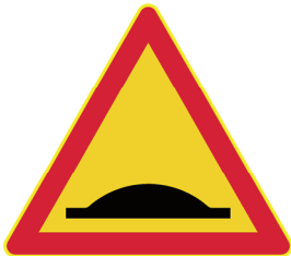
141 a. Töyssyjä

lisätään 13 §:ään, sellaisena kuin se on asetuksissa 328/1994 ja 961/2008, uusi merkkiä 141 a koskeva kohta ja 40 §:ään, sellaisena kuin se on asetuksessa 163/1992, uusi 3 momentti, jolloin nykyinen 3 momentti siirtyy 4 momentiksi, seuraavasti: