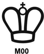
Figur 2. Besiktningsorganets förseglingsmärke och besiktningsorganets symbol.