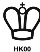
Figur 3. Servicefirmans förseglingsmärke och servicefirmans symbol. Servicefirmans symbol är HK och ett tvåsiffrigt tal hopskrivna.