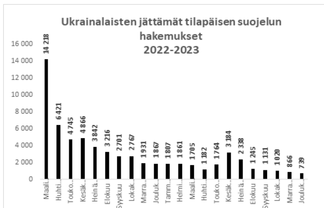
Taulukko 2: tilapäistä suojelua hakeneet ukrainalaiset 2022-2023

Suomessa on jätetty vuoden 2023 loppuun mennessä yhteensä noin 65 500 tilapäisen suojelun hakemusta, joista noin 18 800 vuonna 2023. Vastaanottojärjestelmässä tilapäistä suojelua saavia on noin 27 200.