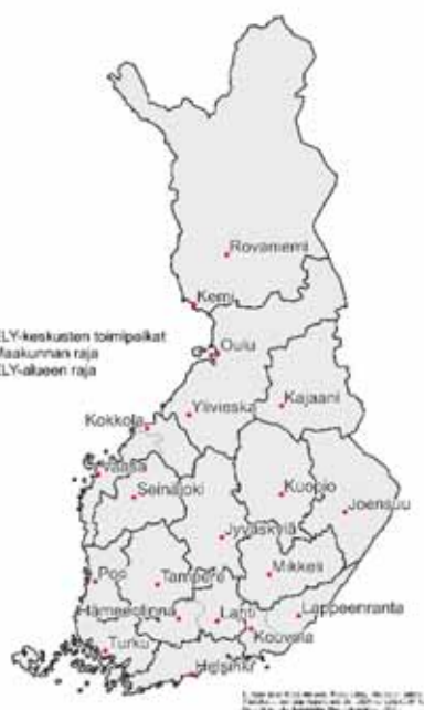
Kuva 1. Karttakuva nykytilanteesta.