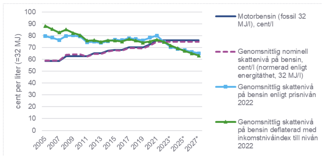
Figur 1. Skattenivåns utveckling för bensin.

På marknaden finns dessutom höginblandade biodrivmedel som är framställda enbart av förnybara råvaror. För varje liter bränsle som släpps ut på marknaden ska i skatt tas ut minst det minimibelopp som anges i energiskattedirektivet. Om den enligt skattetabellen beräknade skatten på en enskild bränslekomponent som släpps ut på marknaden eller en bränsleblandning som består av flera drivmedelskomponenter och som släpps ut på marknaden stannar under den miniminivå som anges i direktivet, ska bränslet beskattas enligt miniminivån.