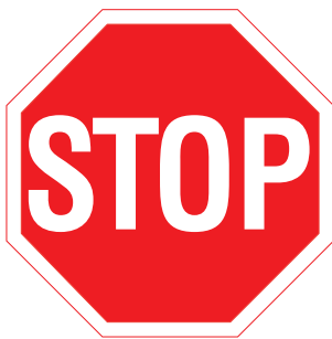
232. Obligatoriskt att stanna

Märket anger att fordon som kommer till korsningen skall väja för fordon och spårvagnar som kommer till korsningen från en korsande väg eller från en riktning med förkörsrätt. På en cirkulationsplats anger märket att fordon som kommer till cirkulationsplatsen skall väja för fordon och spårvagnar som trafikerar cirkulationsplatsen. Försett med tilläggsskylt 815 kan märket användas som förhandsmärke. Försett med tilläggsskylt 816 kan det användas som förhandsmärke för märke 232. Med märket kan även anges väjningsplikt som avses i 14 § 3 eller 4 mom. vägtrafiklagen.