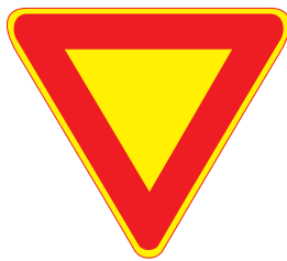
231. Väjningsplikt i korsning

Märket anger en väg för vars trafik fordon och spårvagnar som kommer in från en korsande väg skall väja. Väjningsplikten är angiven med ett vägmärke, om den inte grundar sig på bestämmelsen i 14 § 3 eller 4 mom. vägtrafiklagen. Märket sätts upp i början av en sådan väg och vid nödvändiga ställen utmed vägen.