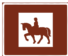
774 f. Ratsastuspaikka