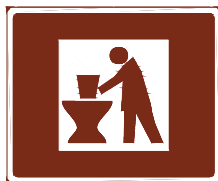
774 d. Käsityöpaja