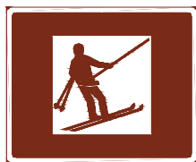
773 c. Hiihtohissi