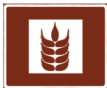
774 c. Suoramyyntipaikka