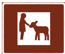
774 e. Kotieläinpiha