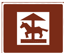
773 e. Huvi- tai teemapuisto