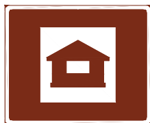
774 a. Mökkimajoitus