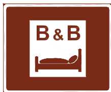
774 b. Aamiaismajoitus