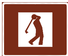
773 d. Golfkenttä